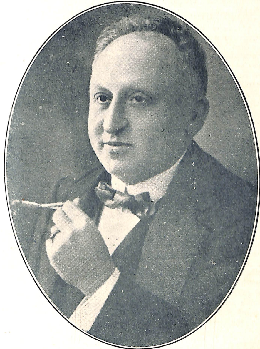
Dr. Mario Roso de Luna

E L cable nos anuncia la desencarnación del Dr. Mario Roso de Luna, sabio astrónomo, químico, filósofo y pedagogo. El Dr. Roso de Luna es autor de numerosas obras científicas y espiritualistas, entre las que podemos citar: «En el Umbral del Misterio», «Hacia la Gnosis», «El Velo de Isis», «La Esfinge». Hace algunos años visitó nuestro país pronunciando interesantes conferencias teosóficas. Nos sentimos identificados con todos los que luchan por mejorar a la humanidad moral, intelectual o económicamente. En este sentido el Dr. Roso de Luna merece nuestra simpatía y homenaje.