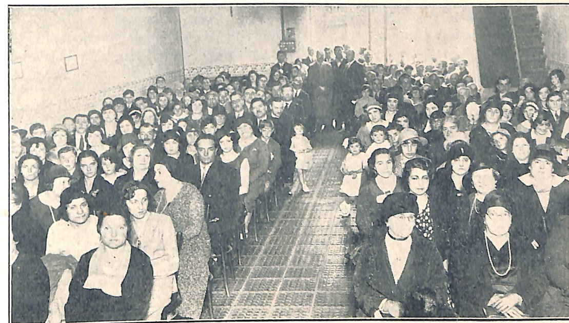
Aspecto que ofrecía la sala

defensa de sus principios, para el apoyo solidario de sus adeptos y la mayor eficacia de todas sus actividades, va conciliando pareceres, persuadiendo errores, unificando ideas y actitudes, condensando poco a poco los anhelos espiritistas y orientándolos hacia un Espiritismo sin ritos, sin dogmas ni sectarismos, realizando de este modo la anhelada unificación de los espiritistas en nuestro país. Y aún dentro de la misma Confederación (sin hacer cuestión de personas ni de círculos y dentro de un espíritu conciliador) LA IDEA ha tratado de reflejar los sentimientos más puros, las aspiraciones más elevadas, las ideas e iniciativas más avanzadas y conformes con el pro-