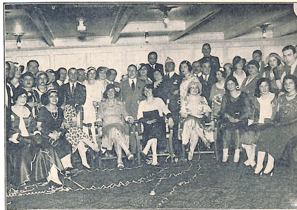
Parte de la concurrencia que asistió, a bordo de la hermosa nave