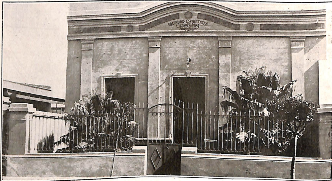
Vista del frente del local social propio, que ocupa la Sociedad.