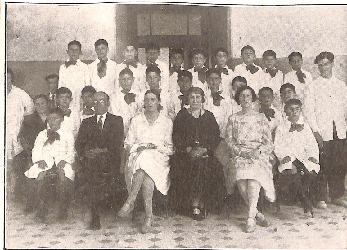
Niños que se educan en el Asilo, con el personal Directivo, docente y de servicio.

A las muchas felicitaciones que recibiera la señora Directora y demás personal docente, por el éxito de la fiesta y el grado de educación manifiesto en los pequeños asilados, sumamos muy sinceramente las nuestras.