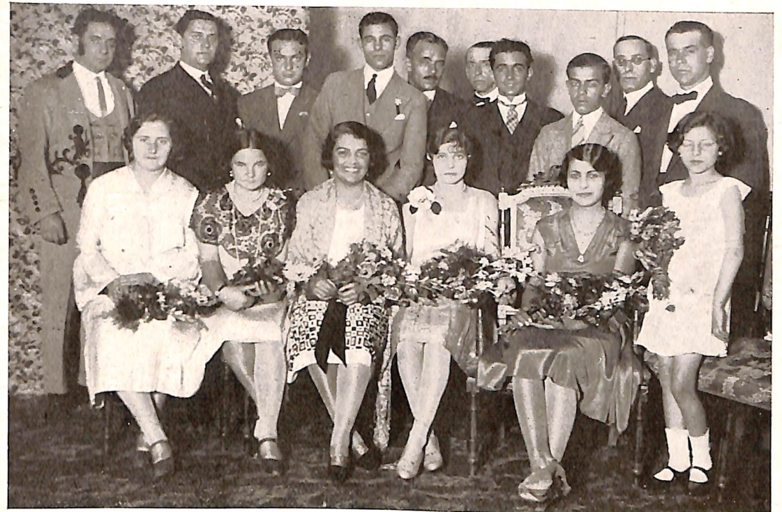
Grupo de correligionarios de las distintas sociedades confederadas que tuvieron a su cargo la realización de los diversos números que componían el agradable programa.