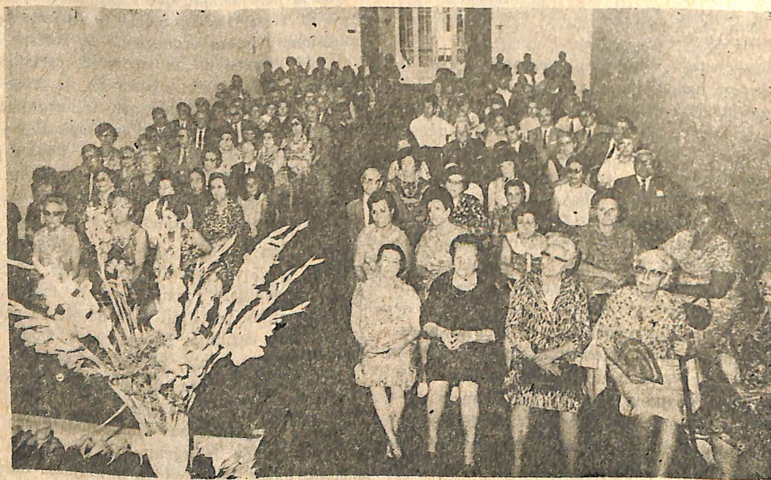
Público concurrente al acto de cierre del Año del Centenario de Kardec, realizado en la CEA el 14 de diciembre del pasado año.

La Federación Argentina de Mujeres Espíritas realizó durante los días 25 y 26 de