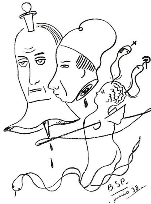
Este dibujo metapsíquico, fechado en junio de 1938, anuncia el fin de Mussolini e Hitler y la unión por el amor de los signos del comunismo y de la iglesia. Curioso mensaje premonitorio dibujado por vía mediumnímica por Solari Parravicini.